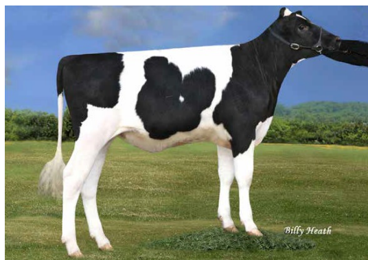
Lot 4 - IVF Session