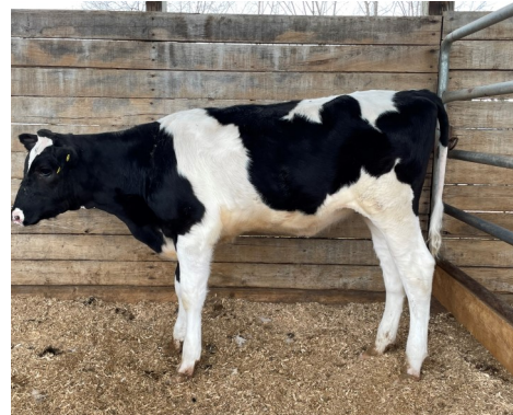
Lot 6 - IVF Session