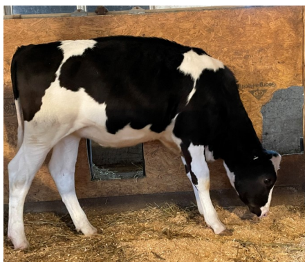
Lot 5 - IVF Session