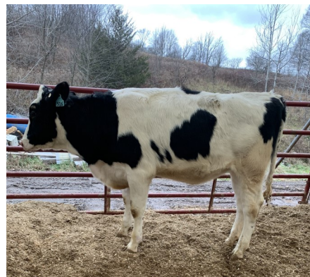
Lot 3 - IVF Session