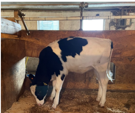
Lot 2 - IVF Session