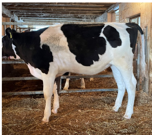
Lot 7- IVF Session